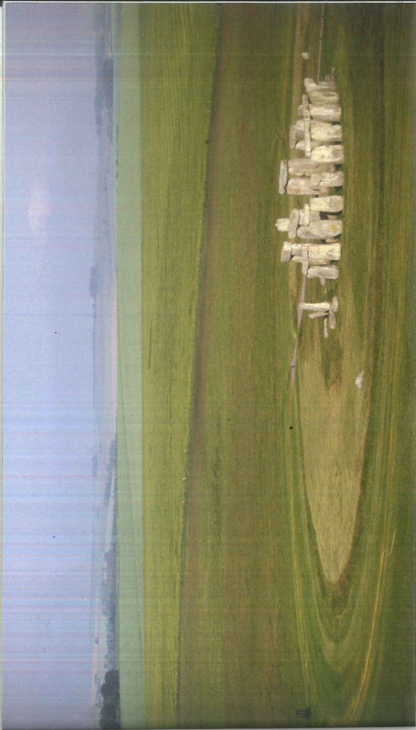
Stenarna stod i en ring. Jämför med teckningen.